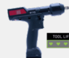
EL TIEMPO DE VIDA DE LA HERRAMIENTA SE EXTIENDE.